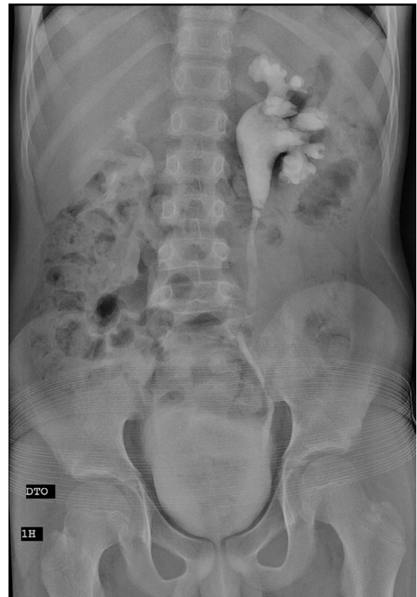
Figura 1 Urografia endovenosa mostra uma imagem de subtração transversal ao nível da JPU.

O doente foi proposto para pieloplastia desmembrada aberta. Intraoperatoriamente, constatou-se a existência de obstrução intrínseca da JPU pela presença de 2 pólipos ao nível do ureter proximal (figs. 2 e 3). Foi efetuada pieloplastia desmembrada segundo a técnica de Anderson-Hynes