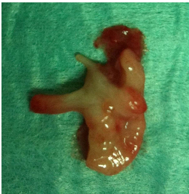
Figura 3 Peça operatória. A seta indica um pólipo intraureteral.

mesodérmica, que correspondem a projeções da mucosa compostas por estroma fibroso coberto por urotélio 2 , que podem ocorrer em todo o aparelho urinário. A localização mais comum destes pólipos é a JPU e o ureter proximal, seguidos da uretra posterior e do ureter médio e distal 3 . Outros tumores benignos menos comuns são os leiomiomas, papilomas, hemangiomas, linfangiomas, granulomas ou fibromas. São mais frequentes no sexo masculino e do lado esquerdo 3-5 . Podem ser únicos ou, mais frequentemente, múltiplos 6 .